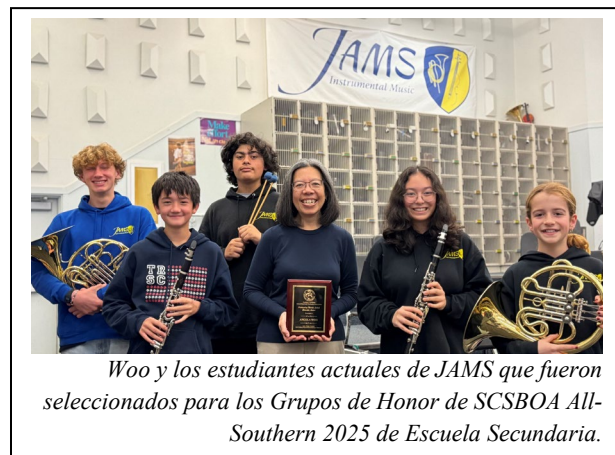
Woo y los estudiantes actuales de JAMS que fueron seleccionados para los Grupos de Honor de SCSBOA All-Southern 2025 de Escuela Secundaria.

orientadora principal desde mi infancia como una joven pianista y violinista. Al haber participado en los eventos de la SCSBOA durante mis años en la secundaria, el poder de la música me vinculó con una comunidad que me permitió explorar la maestría musical a través de la práctica en actuaciones en vivo”.