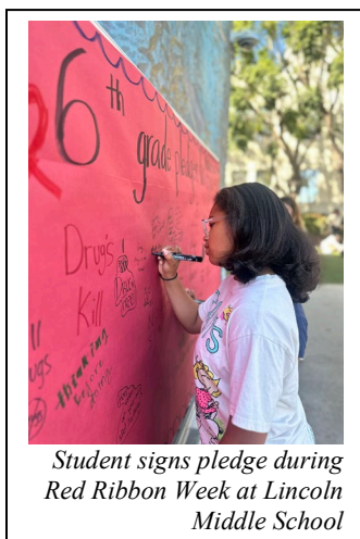
Student signs pledge during Red Ribbon Week at Lincoln Middle School

John Adams Middle School brought therapy dogs to campus, which provided students with emotional support while promoting the “Say No to Drugs” message. Students signed pledges, interacted with informational booths, and enjoyed a memorable, pet-friendly experience that reinforced the benefits of leading a healthy, drug-free life.