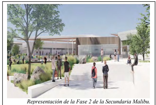
Representación de la Fase 2 de la Secundaria Malibu.