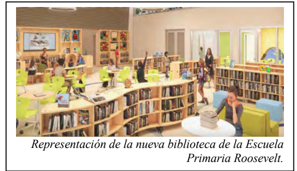
Representación de la nueva biblioteca de la Escuela Primaria Roosevelt.