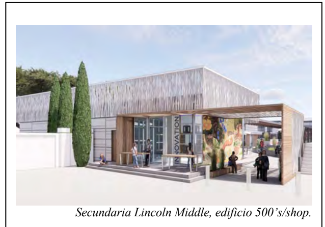
Secundaria Lincoln Middle, edificio 500's/shop.

El compromiso del distrito sigue siendo establecer entornos académicos listos para el futuro que empoderan a los estudiantes para que logren su mayor potencial tanto académico como socioemocional. Muchos de los proyectos que se planean están en la fase de diseño o ya está programado el inicio de la construcción.