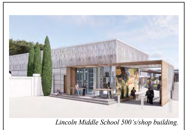
Lincoln Middle School 500's/shop building.

The District remains committed to creating future-ready learning environments that empower students to reach their fullest potential, both academically and social-emotionally. Many of the planned projects are already in the design phase, and scheduled to begin construction.