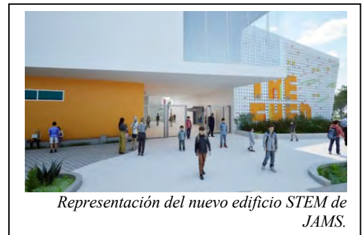
Representación del nuevo edificio STEM de JAMS.

Para más información acerca de estos proyectos de la Medida QS y otros posibles proyectos, dirigirse a: https://bit.ly/MeasureQSProjectList .