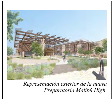
Representación exterior de la nueva Preparatoria Malibú High.

El nuevo edificio de la Escuela Preparatoria Malibú (MHS) abrirá sus puertas en agosto de 2025, cinco meses antes de lo previsto y dentro del presupuesto. Diseñado para integrarse a la perfección con el paisaje costero, el nuevo campus servirá como un centro dinámico para la innovación y el aprendizaje con visión de futuro. Contará con espacios flexibles y colaborativos que fomentan el aprendizaje basado en proyectos, la creatividad y el pensamiento crítico, ofreciendo a los estudiantes un entorno diseñado para el futuro. Los estudiantes de último año podrán disfrutar de estas nuevas instalaciones de vanguardia, que han visto desarrollarse durante varios años, durante todo el año escolar.