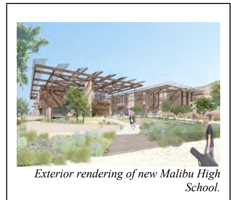
Exterior rendering of new Malibu High School.

The new Malibu High School (MHS) building is set to open its doors in August 2025, five months ahead of schedule and on budget. Designed to blend seamlessly with the coastal landscape, the new campus will serve as a vibrant hub for innovation and future-ready learning. It will feature flexible, collaborative spaces that foster project-based learning, creativity, and critical thinking, providing students with an environment built for the future. Rising seniors will be able to enjoy this new state-of-the-art facility they have watched take shape for several years for their full school year.