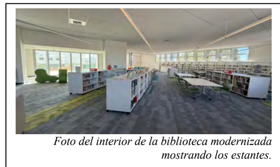
Foto del interior de la biblioteca modernizada mostrando los estantes.

¡Celebremos! La Escuela Secundaria John Adams Middle (JAMS) celebrará una ceremonia de corte de listón inaugural para su biblioteca recientemente modernizada el miércoles, 19 de febrero a las 4p.m. Este evento celebra la finalización de la biblioteca de vanguardia, un espacio dinámico donde los estudiantes se pueden sumergir en la lectura, explorar nuevas ideas, y colaborar en un entorno acogedor. La biblioteca refleja el compromiso del Distrito en crear entornos de aprendizaje propicios para el futuro que empoderan a los estudiantes para alcanzar su pleno potencial académicamente tal como socioemocionalmente.