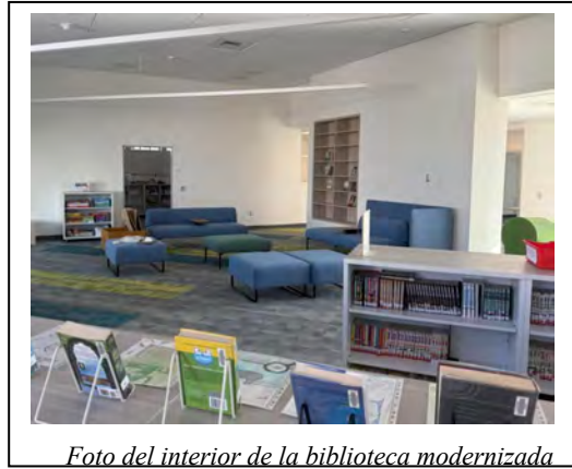
Foto del interior de la biblioteca modernizada

Es inspirador ver a los estudiantes, a los profesores y a la comunidad unirse en un espacio que apoya el desarrollo académico y socioemocional".