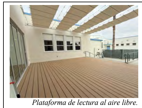
Plataforma de lectura al aire libre.