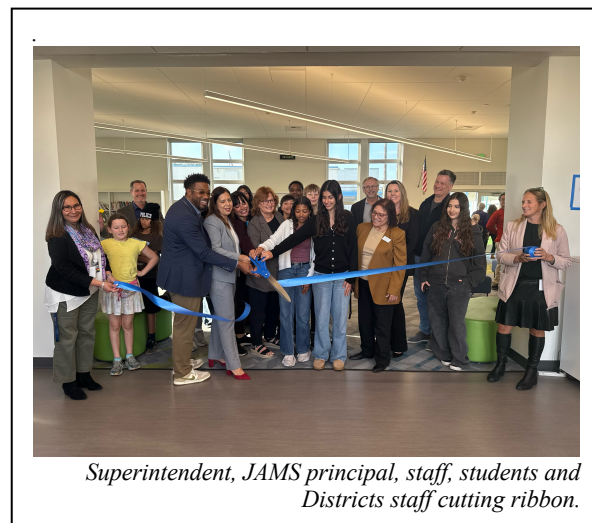
Superintendent, JAMS principal, staff, students and Districts staff cutting ribbon.

John Adams Middle School (JAMS) held a ribbon-cutting ceremony for its newly modernized library on Wednesday, Feb. 19, 2025. The event celebrated the completion of the state-of-the-art library, a dynamic space where students immerse themselves in reading, explore new ideas, and collaborate in a welcoming environment. The library reflected the Santa Monica-Malibu Unified School District's (SMMUSD) commitment to creating future-ready learning environments that empower students to reach their full potential, both academically and social-emotionally.