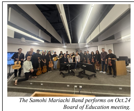
The Samohi Mariachi Band performs on Oct.24 Board of Education meeting.