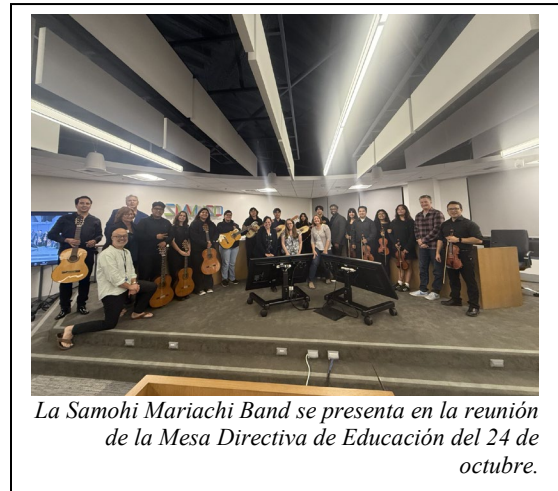
La Samohi Mariachi Band se presenta en la reunión de la Mesa Directiva de Educación del 24 de octubre.