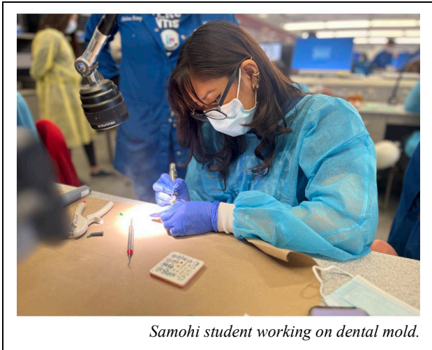
Samohi student working on dental mold.

The summit concluded with a symbolic gesture: each student was awarded a white coat, signifying their introduction to the dental profession and the start of their potential journey in the field. This opportunity exemplifies how Santa Monica-Malibu’s CTE programs offer students practical experiences that align with their interests and career aspirations.