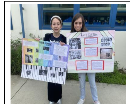
Rogers’ students posing with posters that showcase civil rights leaders.

Through a dynamic and interactive initiative, Rogers’ fifth grade students had the opportunity to create a “Living Museum,” showcasing the lives and contributions of influential leaders such as Rosa Parks, Malcolm X, Harriet Tubman, Martin Luther King Jr. and so many more.