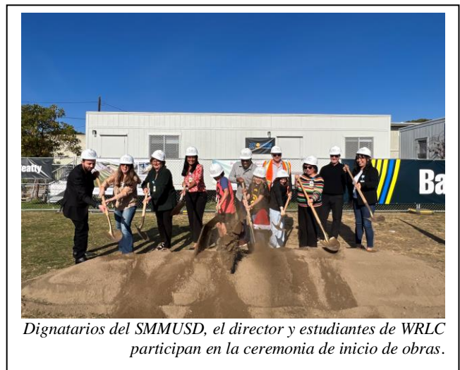
Dignatarios del SMMUSD, el director y estudiantes de WRCL participan en la ceremonia de inicio de obras.

Para celebrar el inicio de la construcción del nuevo edificio para educación en la edad temprana, área de juego y áreas para el aprendizaje al aire libre, el plantel Will Rogers Learning Community llevó a cabo la ceremonia de inicio de construcción el viernes 8 de diciembre de 2023. La Mesa Directiva, el Superintendente, personal del SMMUSD, el director de WRCL, funcionarios públicos, miembros de la comunidad, estudiantes y socios de la construcción, asistieron a la celebración.