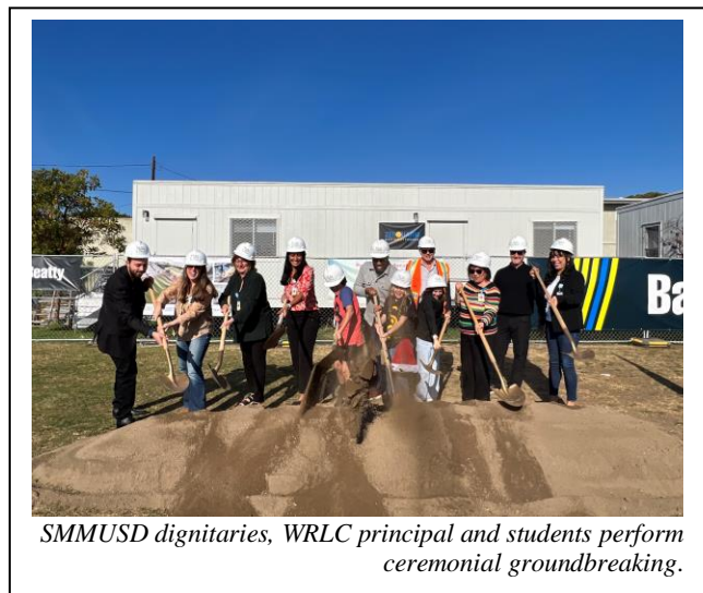
SMMUSD dignitaries, WRLC principal and students perform ceremonial groundbreaking.

To celebrate the start of construction on the new early education building, playfield and outdoor learning areas, Will Rogers Learning Community hosted its groundbreaking ceremony on Friday, Dec. 8, 2023. The Santa Monica Malibu Unified School District’s (SMMUSD) Board of Education, superintendent, WRLC principal, SMMUSD staff, local elected officials, community members, students and building partners attended the celebration.