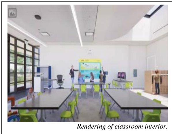
Rendering of classroom interior.