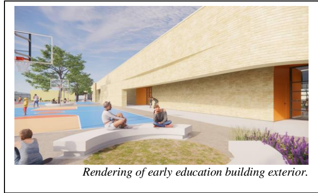
Rendering of early education building exterior.