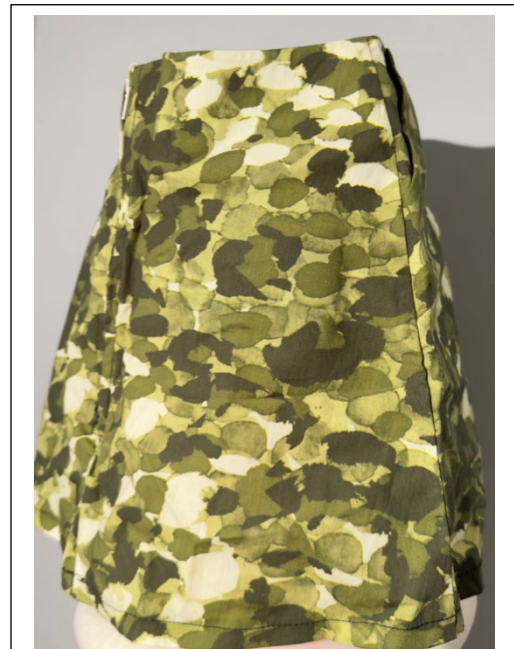
Falda diseñada y creada por Perez-Figueroa