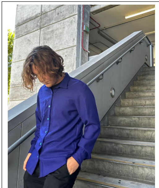
Camisa diseñada y creada por Perez-Figueroa.

Perez-Figueroa planea continuar su trayectoria académica y de la moda como estudiante de moda el Otis College of Design de FIDM. Su camino de PBL Pathway de Samohi a FIDM es un ejemplo del efecto del aprendizaje basado en proyectos, y pone de relieve el compromiso del SMMUSD de apoyar a todos los estudiantes a lograr su máxima capacidad académica y a convertirse en ciudadanos prósperos de la sociedad.