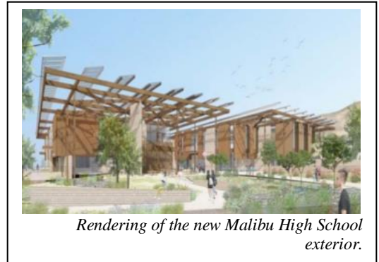
Rendering of the new Malibu High School exterior.