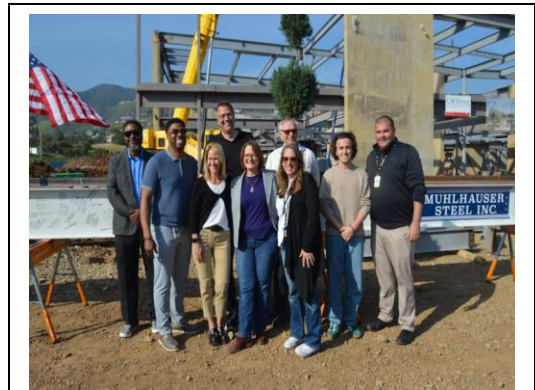
SMMUSD superintendent, Malibu principal, board members, ASB president, Malibu staff and facility improvement staff.