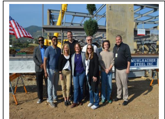
El superintendente del SMMUSD, el director de Malibu, los integrantes de la mesa directiva, el presidente del ASB, el personal de Malibu y el personal de mejora de las instalaciones.