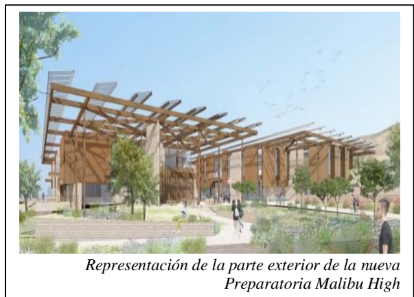
Representación de la parte exterior de la nueva Preparatoria Malibu High

¡Únase a nosotros! Son momentos muy emocionantes para la Preparatoria Malibú High (MHS). Después de años de arduo trabajo, paciencia, dedicación y perseverancia, los salones de clase, oficinas administrativas, biblioteca y cafetería del edificio de la MHS por fin se han hecho realidad. El inquebrantable compromiso de la comunidad, los estudiantes, el personal, los educadores y todos los involucrados han hecho posible este gran logro a pesar de los numerosos retos.