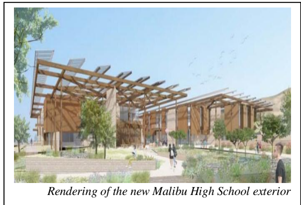
Rendering of the new Malibu High School exterior

Join Us! It's an exciting time for Malibu High School (MHS). After years of hard work, patience, dedication and persistence, the MHS classroom, administration, library, and cafeteria building is finally becoming a reality. The unwavering commitment from the community, students, staff, educators and all those involved, through many challenges, has brought this milestone to life.