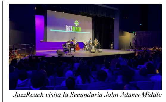
JazzReach visita la Secundaria John Adams Middle

En honor al Mes de la Historia de la Raza Negra, el Distrito Escolar Unificado de Santa Mónica-Malibú (SMMUSD), se asoció a JazzReach, una reconocida organización musical sin afán de lucro a nivel nacional ubicada en Nueva York, para rendir homenaje y celebrar los logros y la influencia de los músicos estadounidenses de raza negra.