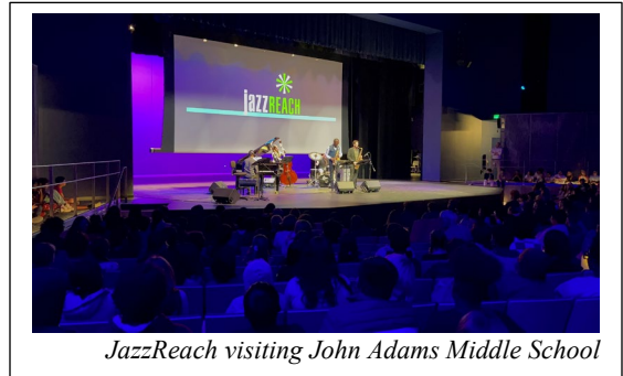
JazzReach visiting John Adams Middle School

In honor of Black History Month, the Santa Monica-Malibu Unified School District (SMMUSD) partnered with JazzReach, a nationally renowned non-profit music organization from New York to honor and celebrate the achievements and influence of Black and African American musicians.