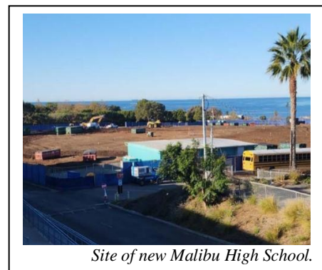
Site of new Malibu High School.

Juan Cabrillo Elementary School, adjacent to MHS, was demolished in 2022. The removal of the elementary school provided space for construction of the new MHS. In addition, all polychlorinated biphenyls (PCBs) along with other hazardous materials have been abated from the site.