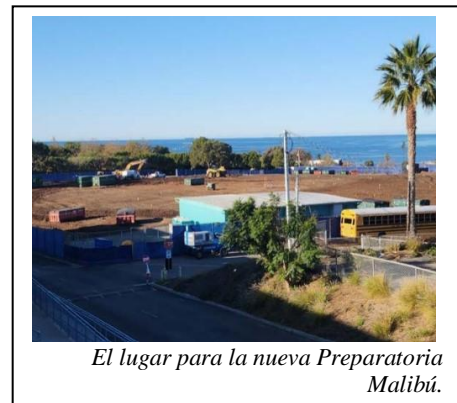
El lugar para la nueva Preparatoria Malibú.

La demolición de la Primaria Juan Cabrillo, adyacente a MHS, se completó en 2022. Además, todos los bifenilos policlorados (PCB) junto con todos los materiales peligrosos han sido removidos. La demolición de la escuela primaria brinda el espacio necesario para la construcción de la Preparatoria Malibu High (MHS).