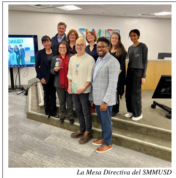
La Mesa Directiva del SMMUSD

Enero es el mes en que se reconoce a la Mesa Directiva y el papel que juega en el rendimiento académico estudiantil. El Distrito Escolar Unificado de Santa Mónica-Malibú (SMMUSD) se enorgullece al unirse a las más de 1,000 instituciones educativas del estado para reconocer las contribuciones de los integrantes de la junta directiva durante el Mes de Reconocimiento de la Mesa Directiva. En estos momentos cuando las escuelas se preparan para acelerar el aprendizaje y apoyar el bienestar de los estudiantes, los integrantes de las juntas de educación desempeñan un papel preponderante en establecer las bases, las políticas y las prioridades para apoyar unos resultados óptimos en los estudiantes.