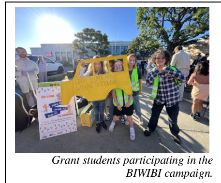
Grant students participating in the BIWIBI campaign.

¡Enhorabuena a los Geckos de la Grant! El Distrito Escolar Unificado de Santa Mónica-Malibú (SMMUSD) se siente honrado al anunciar que la Escuela Primaria Grant se hizo acreedora al reconocimiento Golden Sneaker [El Tenis Dorado] de este año por haber logrado la mayor participación, 89%, durante la campaña Bike It! Walk It! Bus It! (BIWIBI, por sus siglas en inglés) que se llevó a cabo del 2 al 6 de octubre. La escuela también ganó el reconocimiento en la primavera 2023.