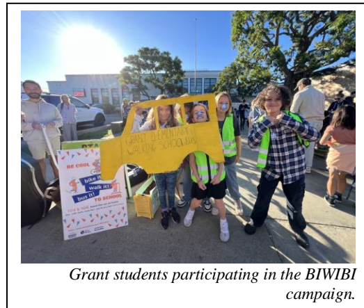
Grant students participating in the BIWIBI campaign.

Congrats Grant Geckos! The Santa Monica-Malibu Unified School District (SMMUSD) is honored to announce Grant Elementary School as this fall's winner of the Golden Sneaker award. Grant had the highest level of participation, at 89%, in the District during the Bike It! Walk It! Bus It! (BIWIBI) campaign, held Oct. 2-6, in partnership with the City of Santa Monica. The school also won the award in spring 2023.