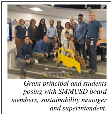
Grant principal and students posing with SMMUSD board members, sustainability manager and superintendent.

Como parte de la celebración del Mes Nacional de andar en Bicicleta, a los estudiantes, al personal, a los voluntarios, a la comunidad en general y a los padres se les instó a utilizar formas alternativas de transportación, ya sea a pie, en vehículos de dos o tres ruedas o servicio de transporte público.