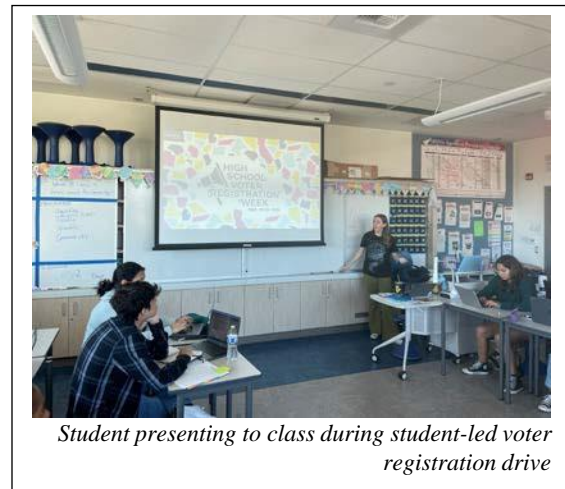
Student presenting to class during student-led voter registration drive