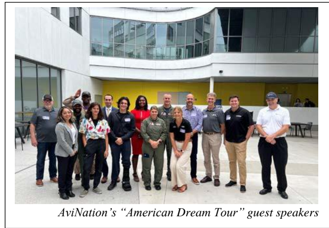
AviNation’s “American Dream Tour” guest speakers