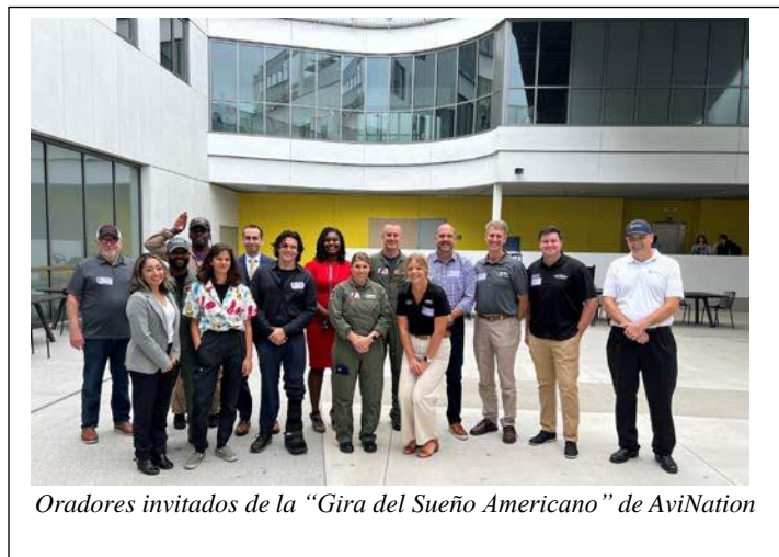
Oradores invitados de la “Gira del Sueño Americano” de AviNation