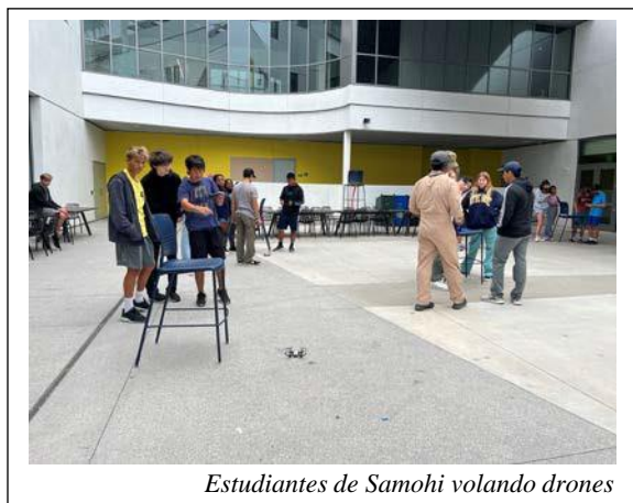
Estudiantes de Samohi volando drones

obtener su certificación de piloto de drones. Los estudiantes también tuvieron la experiencia de volar drones que pilotearon desde sus propios smartphones.