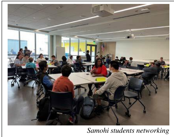
Samohi students networking

The students who attended AviNation’s “American Dream Tour” were broken up into groups that rotated between two networking rooms and the drone flying area outside of the Discovery building. During the networking session Samohi students were able to meet professionals and peers in various aeronautics career paths, including a 15-year-old aerospace student who is building her own plane and a 20-year old college student pilot who is nearing his drone pilot certification. The students then got to experience flying drones that they operated from their own smartphones.