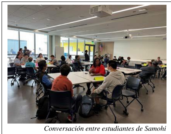
Conversación entre estudiantes de Samohi

Los estudiantes que asistieron a la “Gira del Sueño Americano” de AviNation se dividieron en grupos que rotaron entre dos salas de conversación y la zona de vuelo de drones fuera del edificio Discovery. Durante la sesión de conversación, los estudiantes de Samohi pudieron conocer a profesionales y compañeros de varias carreras aeronáuticas, incluyendo a una estudiante aeroespacial de 15 años que está construyendo su propio avión, y a un estudiante universitario de 20 años que está pronto a