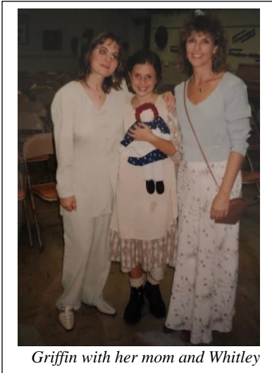
Griffin with her mom and Whitley

“She created an atmosphere where we all recognized that there were things we were fantastic at and things that we struggled with and that allowed us all to, simultaneously, be the star of the show and a mentor to others while also being mentored,” said Griffin.