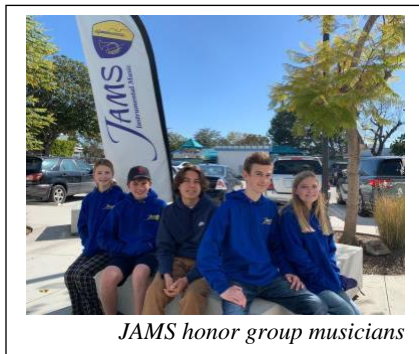
JAMS honor group musicians