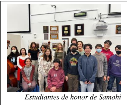
Estudiantes de honor de Samohi

Para acceder a la lista completa del coro, orquesta y banda SMMUSD All-State and Honor Choir, Orchestra and Band , visite: https://bit.ly/AllStateHonorsList2023 .