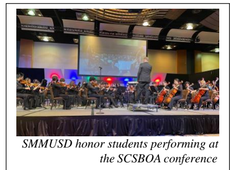
SMMUSD honor students performing at the SCSBOA conference

The Santa Monica-Malibu Unified School District (SMMUSD) would like to congratulate the 41 Santa Monica students who were named to the All State and Southern California School Band and Orchestra Association (SCSBOA) Honor Choir, Orchestra, Band, and to the 2023 California All State Music Education Conference (CASMEC).