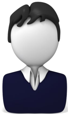
Representantes Escolar de DELAC