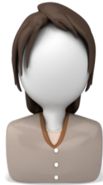
Vice-President e (a)