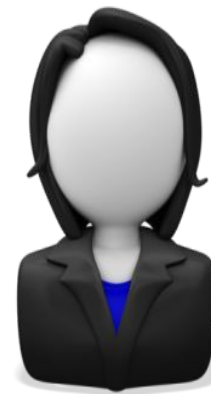
Representantes Escolar Alternos de DELAC