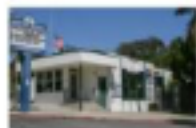
John L. Webster Elementary

3902 Winter Canyon Road Malibu, CA 90265 310-456-6404