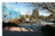
Point Dume Marine Science

8055 Fernhill Drive Malibu, CA 90265 310-457-0370