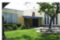
Will Rogers Learning Community

2401 14th Street Santa Monica, CA 90405 310-452-2364