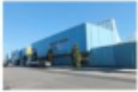
Edison Language Academy

2402 Virginia Avenue Santa Monica, CA 90404 310-828-0335