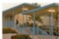
Malibu Middle/High School