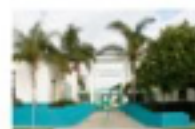
Roosevelt Elementary School

801 Montana Avenue Santa Monica, CA 90403 310-395-0941