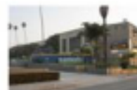
Santa Monica High School