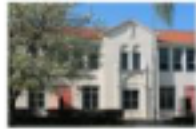
McKinley Elementary School

2431 Santa Monica Boulevard Santa Monica, CA 90404 310-828-5011