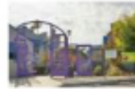
John Muir Elementary School

2526 Sixth Street Santa Monica, CA 90405 310-309-7721