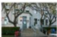
Lincoln Middle School