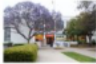
Grant Elementary School

2388 Pearl Street Santa Monica, CA 90405 310-450-7651