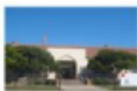
Olympic High School