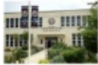
Franklin Elementary School

2400 Montana Avenue Santa Monica, CA 90403 310-828-2814