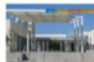
John Adams Middle School

2425 16th Street Santa Monica, CA 90405 310-452-2326