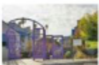
SMASH Alternative School

2525 5th Street Santa Monica, CA 90405 310-306-2640