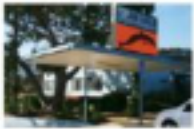
Juan Cabrillo Elementary

30237 Morning View Drive Malibu, CA 90295 310-457-0360